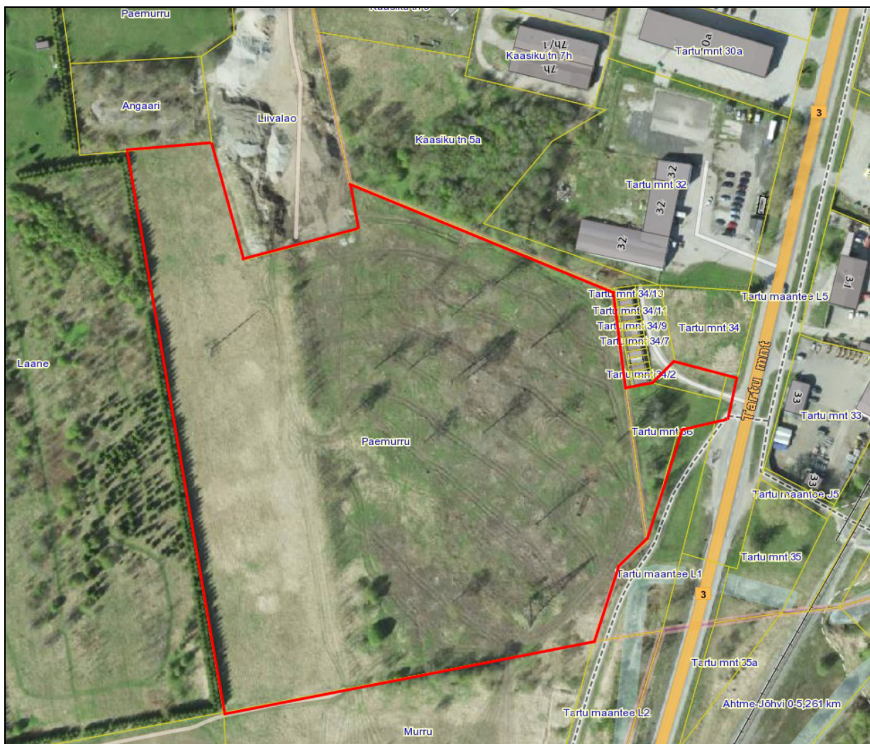
Skeem 1. Planeeritava maa-ala piir (algatamise korralduse kohane). Planeeritav maa-ala on markeeritud punase joonega.

Planeeringuala lähipiirkonda Tartu mnt äärde jäävad valdavalt äri- ja tootmismaad, mis tänava iseloomu ning mõjusid arvestades on asjakohane maakasutus. Tartu mnt 36 kinnistust põhja poole jäävad garaažid. Elamumaad jäävad planeeringualast idasuunda Jõhvi linna mikrorajooni poole. Lõunast ja läänest on planeeritav ala ümbritsetud valdavalt põllumaaga. DP alast lõuna suunas, Murru katastriüksuse maa-alal, on registreeritud III kaitsekategooria kaitsealune liik rukkirääk ( Crex crex , keskkonnaregistri kood KLO9124824).